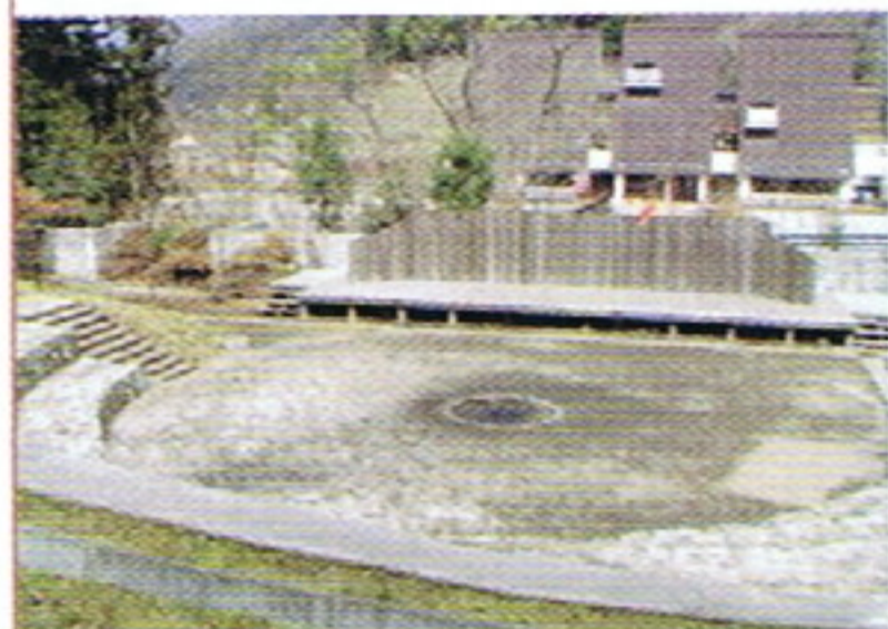
星ふる広場(キャンプファイヤー場)

星空のきれいな山のキャンプ場です。屋外ステージのあるキャンプファイヤー場や野外炊事場があります。