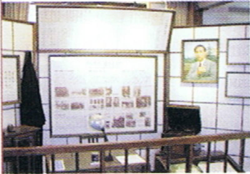
中村雨紅展示ホール