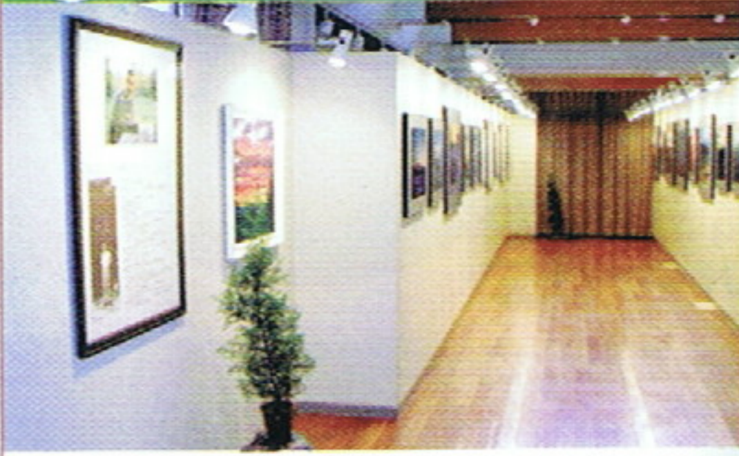
前田真三ギャラリー