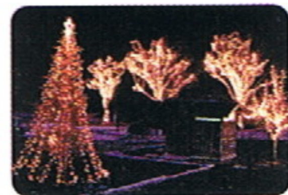
クリスマスイルミネーション