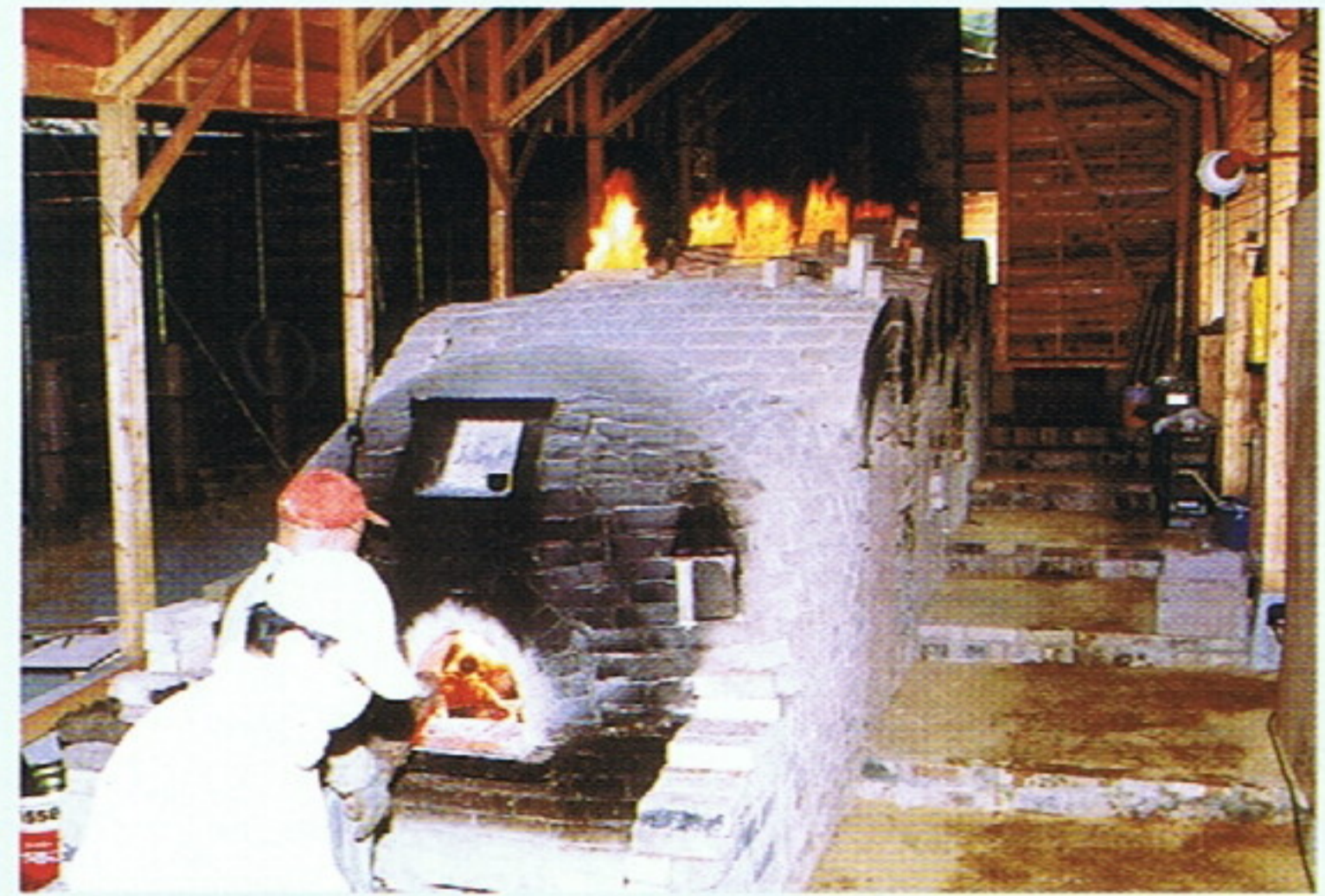
夕やけ小やけふれあいの里 「登り窯」