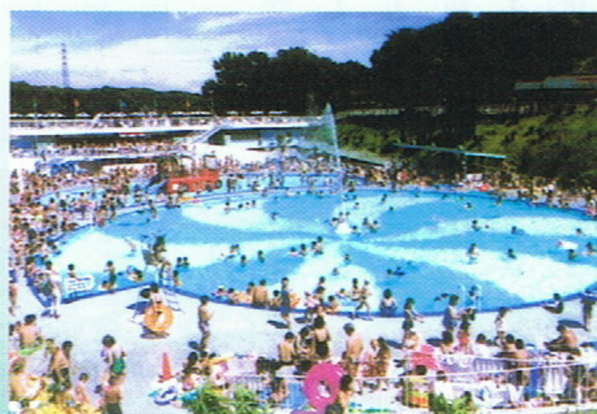
ファミリー大賞「夏はプールだ 夏休みの思い出」

第二十七回八王子の四季観光写真コンクールの審査が昨年6月14日に行われ、入賞作品26点が決定しました。今回の応募は244点で、入賞作品は8月23日から27日まで市役所2階市民ロビーに展示しました。これら作品は今後パンフレットやカレンダー等に活用し、観光客の誘致宣伝を図っていきます。