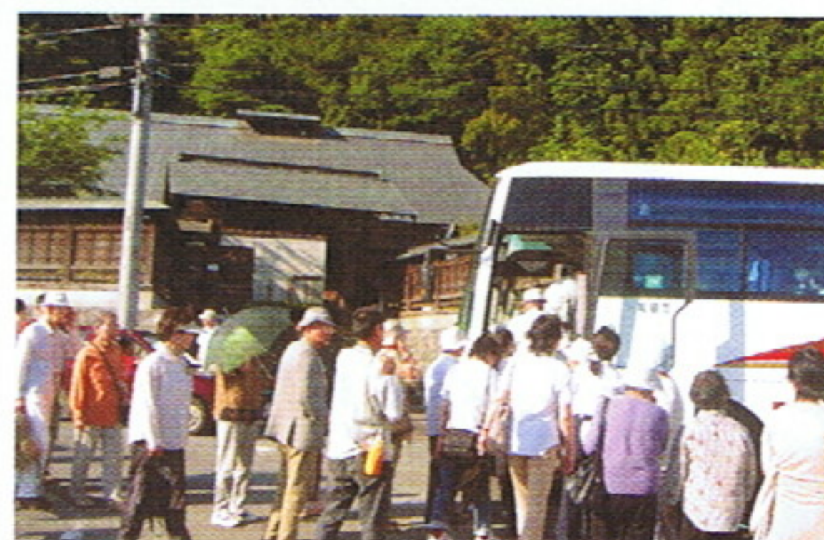
絹の道資料館前 (市内観光とカジカガエルの声を聞く会)

何れも35年以上続く恒例行事ですが、今年は新たなツアーとして「カジカガエルの声を聞く会」に市内観光地を組み入れ、リピーターの方にもお楽しみいただきました。歴史あふれる絹の道を散策した後、高尾山麓でのカジカガエルの魅惑的な声を聴き、また清滝駅近くで鑑賞したゲンジボタルの幻想的な光の舞に、参加されたお客様からは歓声があがりました。