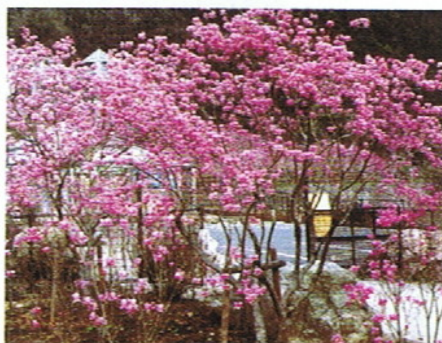
ミツバツツジが咲きほころぶ タヤけ小やけふれあいの里園内

35,000球のイルミネーションとともに、屋外では17メートルの2本のツリーとサンタクロースやトナカイが入園者をお出迎え、また温室館内に一步入ると輝く7メートルのツリーが夢の世界へと入園者を誘っておりました。