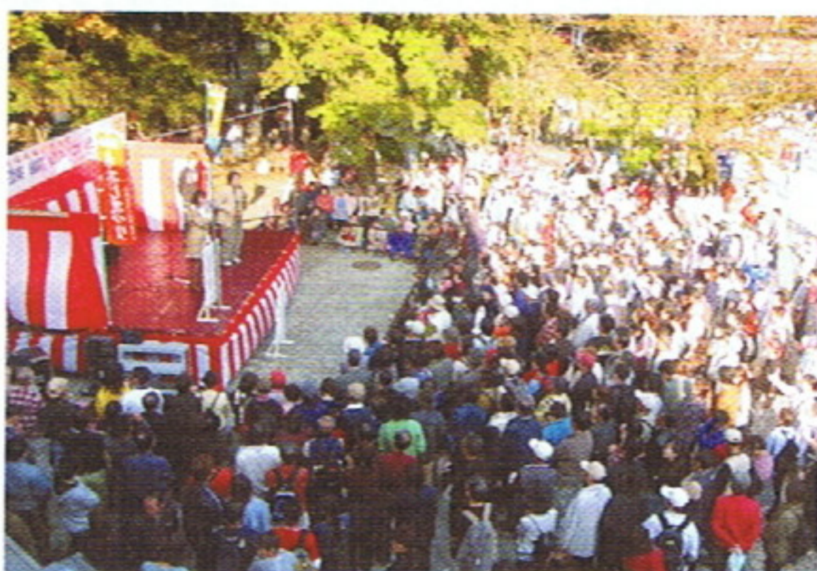
イベントで盛り上がる清滝駅前ステージ (もみじまつり11月3日より)

2年ぶりに夏の風物詩として打ち上げをした「八王子花火大会」。八王子まつりの前週となる7月31日に、約5万人の観客に囲まれた市民球場で約3,400発の花火が大輪の華を咲かせ、浴衣に団扇姿の観客からは大きな歓声があがりました。