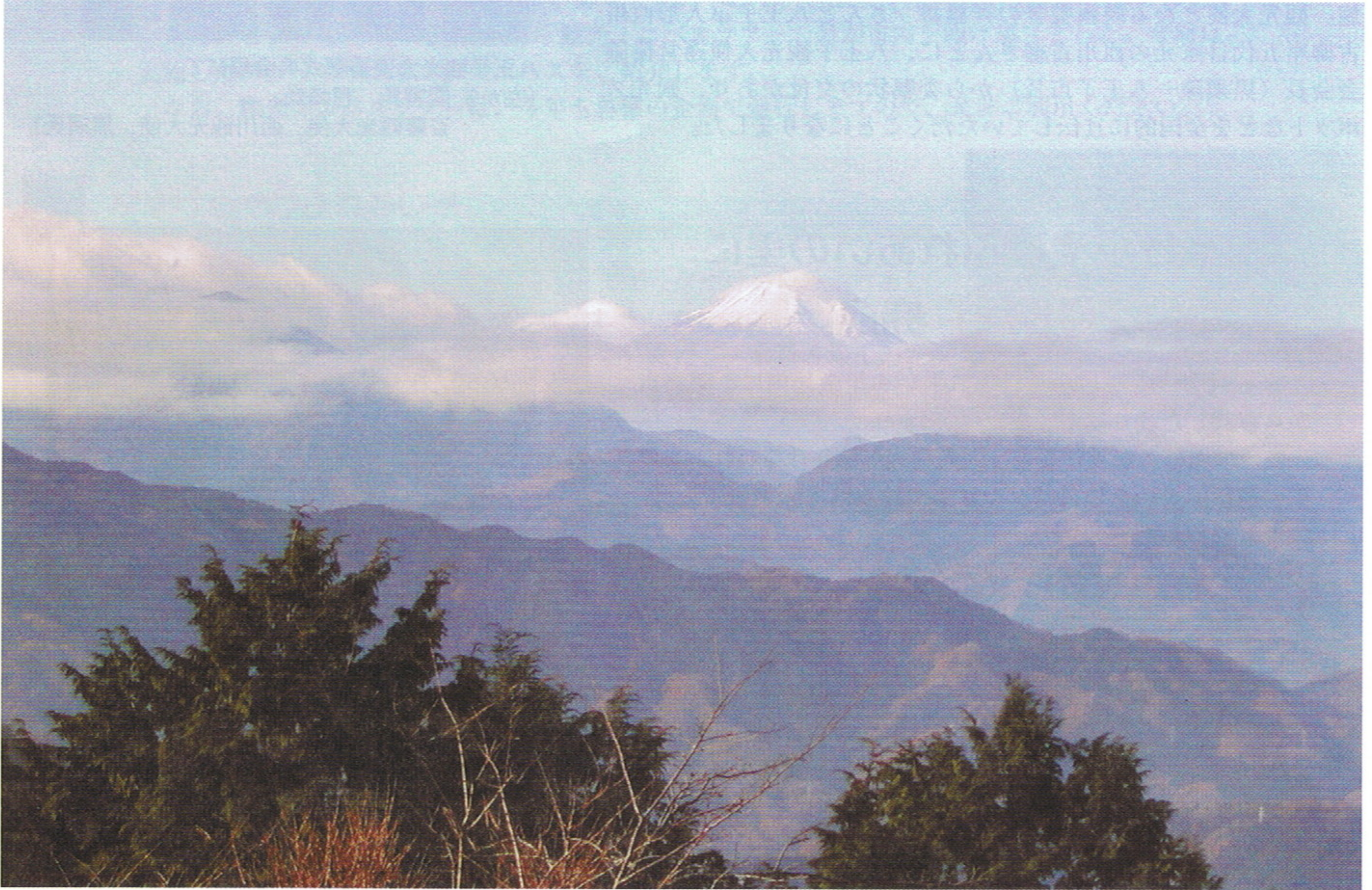
国土交通省「関東富士見百景」に選ばれた高尾山頂から富士山を望む

編集・発行 (社)八王子観光協会 〒192-0083 八王子市旭町12-1 ファルマ802ビル内 TEL 0426(43)3115 FAX 0426(43)3110