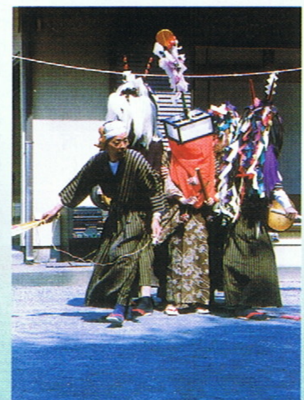
推薦「籠獅子舞佳境」