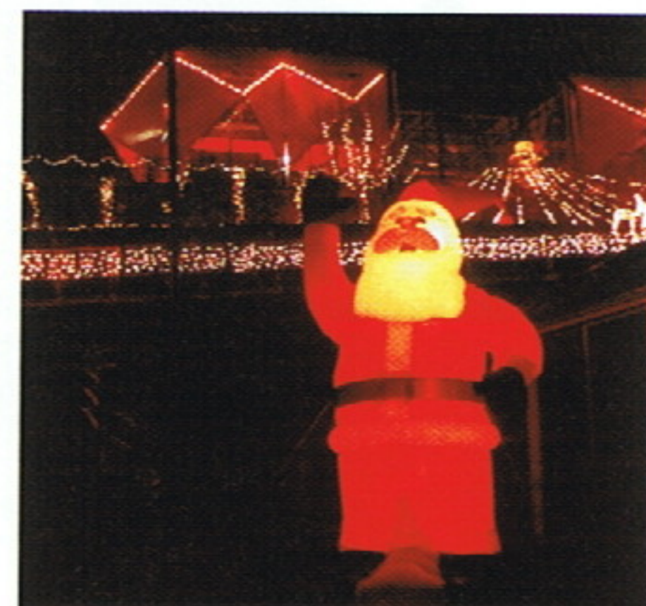
「サンタクロースがお出迎え クリスマスイルミネーション」