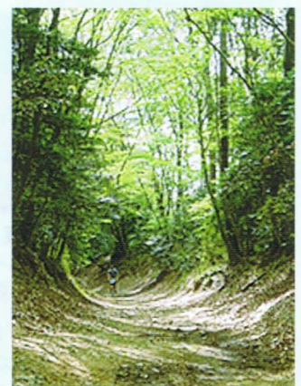
昔の面影が残る絹の道

安政6年(1859)の横浜開港以降、主にヨーロッパに輸出される生糸が横浜へと運ばれていたルートのひとつです。当時は、「神奈川往還」「浜街道」と呼ばれ、「絹の道」と呼ばれるようになったのは昭和の中頃からです。昭和47年(1972)に比較的かつての雰囲気が残っている大塚山公園(道了堂跡)から御殿橋のたもとまでの、約1.5kmが市の史跡に指定され、平成8年(1996)には未舗装部分1kmが文化庁により「歴史の道100選」に選ばれました。当時の面影が残る歴史の道をゆっくり散策してみたいかがでしょうか。