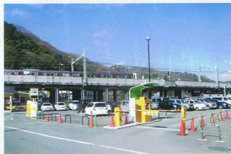
機械式になった高尾山麓駐車場

昨年4月、京王高尾線高尾山口駅前にある市営高尾山麓駐車場が一部機械化され、料金体系も30分ごとの時間制となりました。一昨年は高尾山を訪れた観光客が過去最高を数える人出となり、昨年も引き続き多くの観光客に訪れていただきました。車での来山も増加しており、駐車場スペースも限りあることから隣接している京王高架下臨時駐車場・氷川神社臨時駐車場と共に効率よくご利用いただけるよう、管理していきたいと考えております。