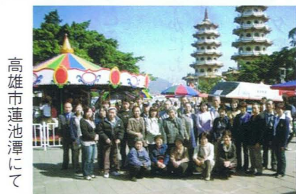
高雄市蓮池潭にて

昨年1月末に実施の台湾高雄市「ランタンフェスティバル」見学ツアーは第3回目となり、25名の市民の方々にご参加いただきました。台北「故宫博物館」見学などのほか、海外友好交流都市の高雄市では市政府主催の歓迎レセプションに招待され、さらに夜にはランタンフェスティバル開会式に参加、会場では高雄市民と一体となり、花火などを堪能しました。本年も2月19日～22日に魅力あるツアーを計画しております。