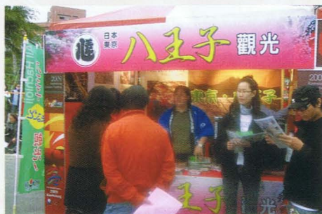
高雄市ランタンフェスティバル会場にて観光PR

また、関係団体と合同で中国の旅行誌にPR記事を掲載して、海外からの観光客誘致に力をいれました。