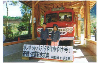
ボンネットバスの前で記念写真

京王八王子駅から陣馬高原下の間で「夕やけ小やけ号」として親しまれていたボンネットバスが、夕やけ小やけふれあいの里に寄贈され、披露記念式典が行われました。紅葉が深まる夕やけ小やけふれあいの里では、大勢の家族連れがボンネットバスに乗ったり、当時の制服・制帽姿で記念写真を撮るなどして、シンボルが増えた園内に明るさが満ちていました。