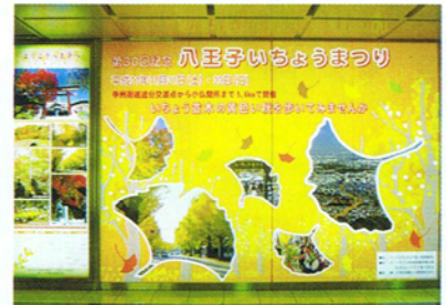
紅葉やいちようまつりを紹介

JR八王子駅を利用される市内外の方に、四季それぞれの風景・イベント・見どころなどの行事予定を紹介しておりますので、是非、ご覧ください。