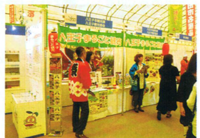
横浜開港150周年記念イベントでのPRの様子