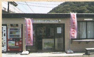
高尾山観光案内所

また、「高尾山観光案内人」は、高尾山麓駐車場の一角に開設した観光案内所に常駐し、一般観光客に高尾山のハイキングコース、花、紅葉の情報や市内観光地の案内などを提供しています。