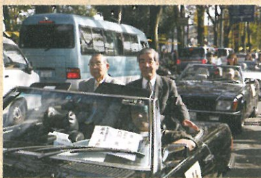
八王子いちよう祭り クラシックカーパレード