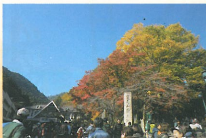
ケーブルカー清滝駅前

土・日・祝日にケーブルカー清滝駅前広場の舞台で民踊おどり・八王子車人形・八王子市消防団音楽隊・太鼓・大道芸など多彩な催しが行われ、霞台ではマヌ酒の販売や東京こけしの実演販売を行いました。