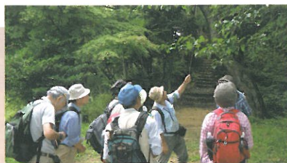
ハイキングガイドツアー

夏には講師を招いての研修を開催し、野外活動で生じるケガや虫刺され、熱中症などの不安を解消する為の安全管理講習を行いました。また、八王子消防署の方からは、AEDの使い方や三角巾を使った止血法などの応急救護の訓練も受けました。今後も高尾山をより安全に楽しくご案内できるよう努めていきます。