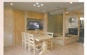
株式会社エンラージ 八王子本店ショールーム

「リフォームが完成したら終わりではなく、その後もお客様との絆を深めていきたい。八王子が好きなので、八王子のために、そして市民の方がよるこんでもらえるような仕事ができる会社にしていきたいですね。」