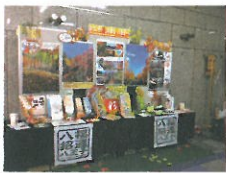
都庁観光PRコーナー (10月)

また、7月・10月には都庁舎1階の観光情報センターにPRコーナーを設置し、7月には花火大会や八王子まつりを、10月には紅葉の見どころなどを、パネルやパンフレットで彩り、都庁を訪れる都民や外国人に紹介しました。