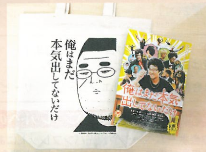
映画「俺はまだ本気出してないだけ」チラシ・グッズ

今後も制作会社からの多種多様な要望に応えるため、会員の皆様へ撮影場所の提供をご相談させていただくことがあるかもしれません。会社、商店、団体、また地域のPRとしてご協力いただけますようお願いいたします。