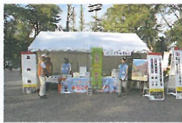
スポーツ祭東京2013での 観光PRブース