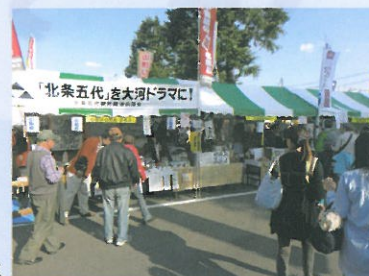
小田原出店ブース