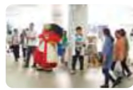
JR静岡駅での観光PRの様子

また、昨年オープンした高尾山口観光案内所には、もみじまつりが開催された紅葉の時期に約4万3千人の来所者がありました。