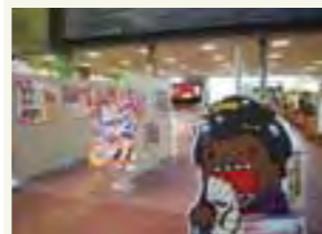
NHK「東京ウエストサイド物語」パネル展

今後も制作会社からの多種多様な要望に応えるため、会員の皆様へ撮影場所の提供をご相談させていただくことがあるかもしれません。会社、商店、団体、また地域のPRとしてご協力いただけますようお願いいたします。