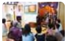
新町会館内の閻魔大王像

これまでご好評をいただいていた市内や近隣地の名所を巡る「八王子観光ミニバスツアー」は、中心市街地を巡るまち歩きをプラスして、今年度から「八王子めぐりツアー」としてリニューアルしました。