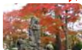
高尾山 紅葉の様子

恒例の「高尾山もみじまつり」が、11月の土・日・祝日にケーブルカー清滝駅前で行われ、高尾山に来られた観光客の皆様を紅葉とともに迎えました。