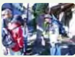
ハイキングガイドツアーの風景

高尾山を訪れる観光客の皆様へ、高尾山の自然や歴史などの魅力を紹介するため、ボランティアの皆様にご活躍して頂いております。豊富な知識と多くの経験を活かし、「高尾山ハイキングガイドツアー」「高尾山見どころガイド」「ガイド派遣」などの活動を行い観光客の皆様にご案内しております。