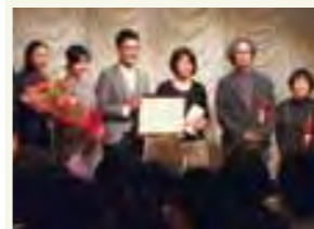
八王子ショートフィルム映画祭