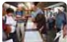
江戸小紋の染色工房 石塚染工

9月26日に「開運!和(わ)・茶(さ)・雅(び)ツアー」と題して、新町や明神町付近のまち歩きツアーを実施しました。ボランティアでまち歩きツアーの活動を行っている八王子くちコミ隊にお手伝いをいただき、16名の参加者とクリエイトホールを出発。市守大鳥神社、竹の花公園&永福稲荷神社、新町閻魔大王像、東京染小紋 石塚染工、子安神社とめぐり、美ささ苑での昼食というコース内容でしたが、新町会館内にある閻魔大王像や、石塚染工など、一般公開していない所の見学が出来たことで、参加者からは大変好評のツアーとなりました。