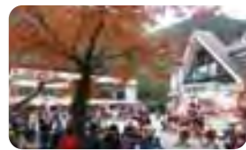
ケーブルカー清滝駅前催し

また、十一丁目茶屋前の露台では、マス酒の販売や東京こけしの実演販売を行い、こちらも盛況のうちに終えることが出来ました。