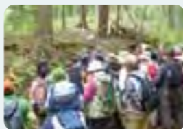
自然観察会の風景

10年目を迎えた高尾・陣馬ファンクラブですが、今年度は継続、新規入会を合わせ約400名の会員となりました。ハイキング、自然観察会の企画・運営、2カ月ごとに高尾・陣馬に関する情報提供、会員からの応募作品で作成した特製カレンダーのプレゼントなどの活動を行いました。