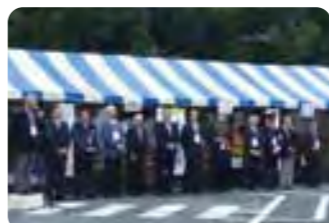
クラシックカーパレード出発式

平成6年5月に、「北條三兄弟三領共同宣言」の盟約を締結した八王子市・小田原市・寄居町の観光協会。そのご縁で両観光協会会長、小田原市副市長、寄居町長をはじめ両市町の方々に、11月22日の「八王子いちよう祭り」にお越しいただきました。クラシックカーパレードではオープンカーやボンネットバスにご乗車いただき、お祭りを見学していただいた後、駆け足でしたが高尾599ミュージアム、ケーブル清滝駅前、高尾山口駅、むささびハウスなどをご覧いただき、高尾山の賑わいの一端に触れていただくことができました。