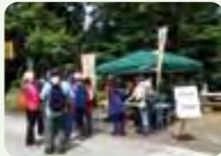
見どころガイドの風景