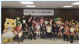
八王子観光PR特使の皆さん

多彩な分野の特使の皆さんによる情報発信で、八王子の観光PRの充実が期待されます。