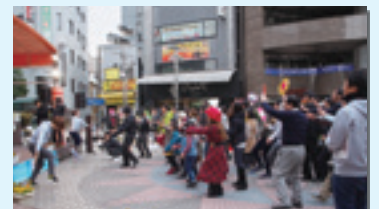
横山町公園でのエキストラ参加風景

また、映画の「何者」と「青空エール」にはエキストラボランティアの派遣も行いました。今後も八王子の魅力PR出来る作品へは積極的に支援を行っていきます。