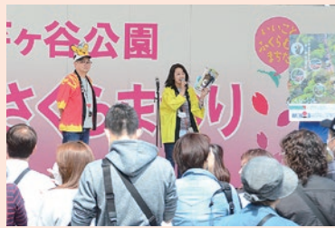
町田さくらまつり