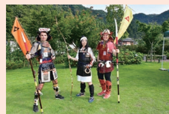
甲冑体験 (NPO法人滝山城跡群・自然と歴史を守る会)