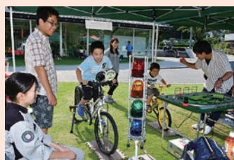
キッズエンジニア体験 (専門学校トヨタ東京自動車大学校)

体験学習事業として、多岐にわたる分野の参加体験型の社会教育活動や交流事業を、街の魅力向上や交流人口の拡大など稼ぐ観光地域づくりにつなげることを目的に、高尾599ミュージアムをメイン会場として、8月に開催しました。