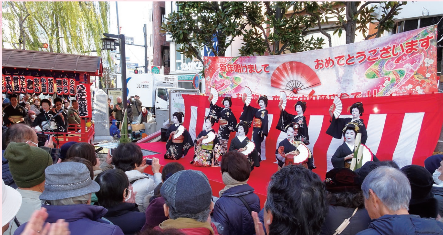
八王子芸妓(芸者)による「初春の舞」 中町公園