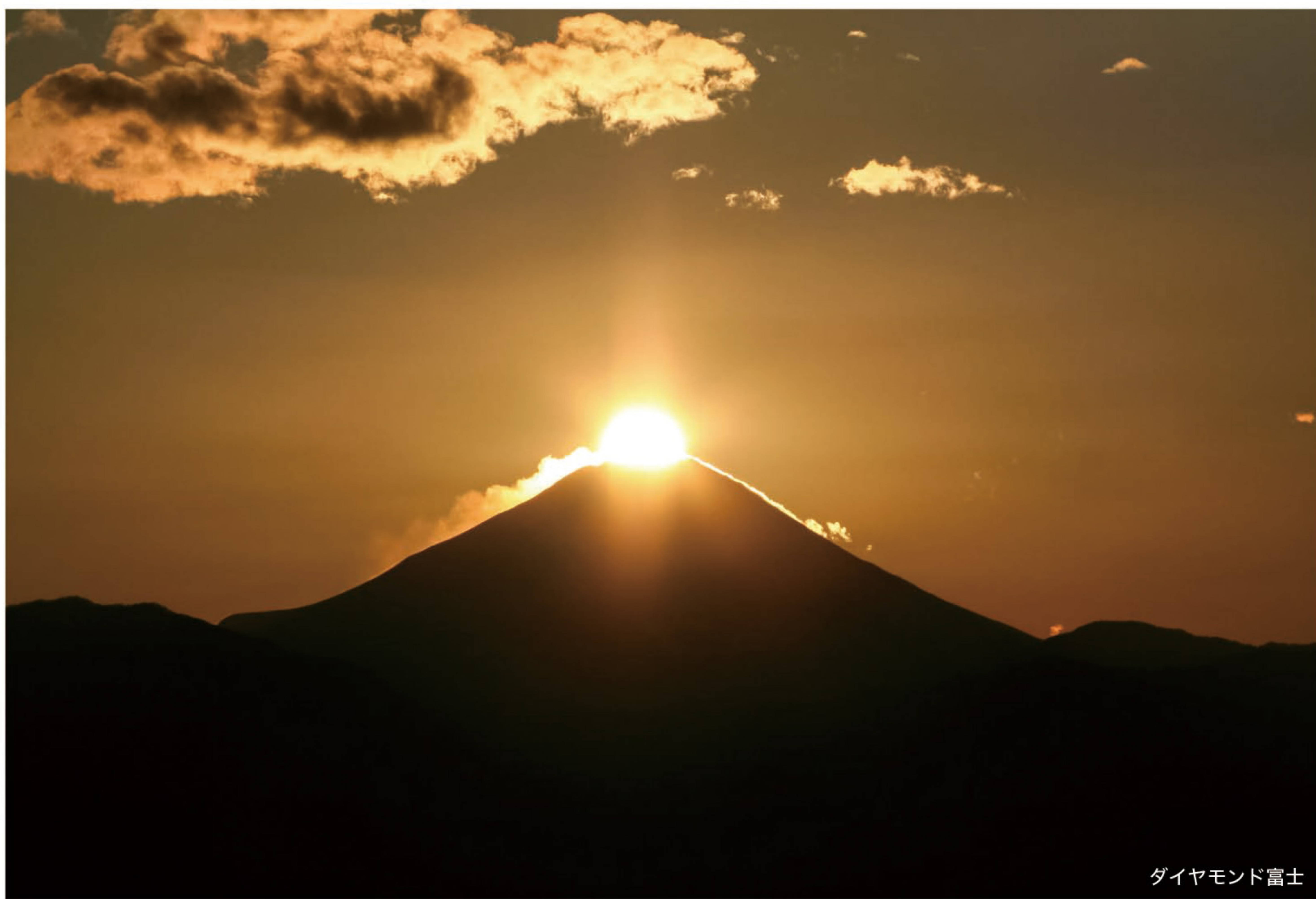
ダイヤモンド富士