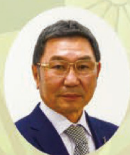
瀧澤副会長 (総務委員長)