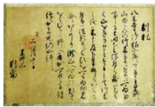
08 高尾山薬王院 文書 (北条氏照発給文書)