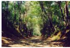
20 絹の道 (浜街道)