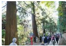
10 高尾山のスギ (都指定天然記念物・ 市指定天然記念物)