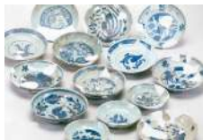
02 八王子城跡 御主殿出土品