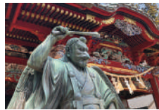
09 高尾山薬王院 の文化財