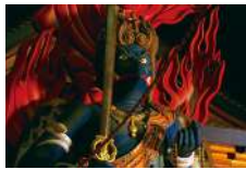
11 御前立御本尊 飯縄大権現像