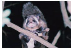
17 高尾山の ムササビ