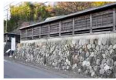
21 八木下 要右衛門屋敷跡 (絹の道資料館)