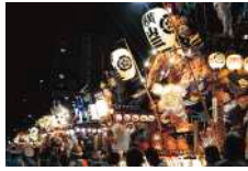
26 上の祭り・ 下の祭り (八王子まつり)