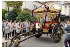
27 上の祭り・ 下の祭りの 神輿・山車