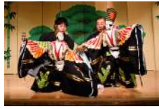
25 八王子車人形 および 説経浄瑠璃