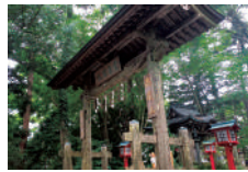
12 高尾山薬王院 浄心門