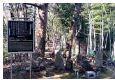
05 北条氏照 および家臣墓