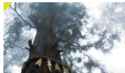
【八王子八景】 高尾の翠靄（すいあい）

山内に立ち込める霧（もや）が「みどり色のもや（翠靄）」と表現され、自然の豊かさや美しさ、そして厳かな靈山の空気感が詠まれています。氏照が愛でた、靈気に満ち緑豊かな「翠靄の景」は、昔も今も変わらずぬ高尾山の大きな魅力です。